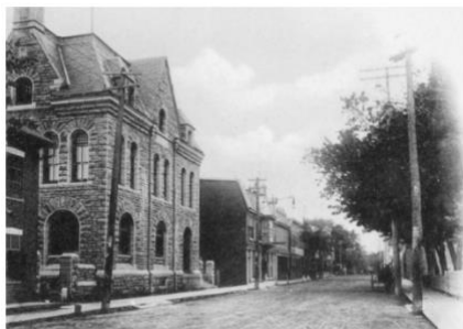
Bureau de Poste