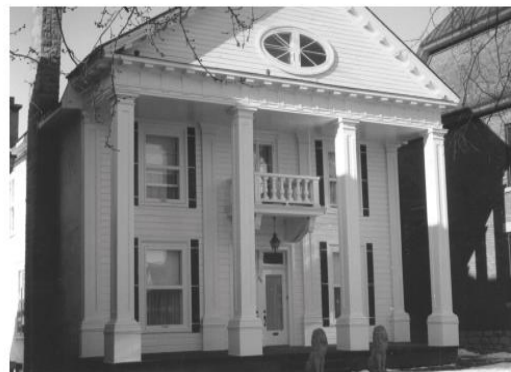
Restaurant Le Bercail, Institut

Notre circuit patrimonial a pour but de faire découvrir l'histoire et l'architecture de certains bâtiments qui font partie du décor de Joliette depuis plus d'un siècle. Ces différents bâtiments ont tous été construits au XIXe siècle. Nous ferons la visite de quatre immeubles soit: l'Institut, le palais de justice, le bureau de poste et l'Arsenal. Ces immeubles témoignent tous d'un aspect de la vie sociale. L'Institut était un point de rassemblement pour la vie communautaire. Ce bâtiment démontre bien le besoin des gens de se retrouver ensemble et de discuter, de jouer à différents jeux. Ensuite, le palais de justice démontre le secteur judiciaire. Cet aspect est encore bien présent, aujourd'hui, à Joliette. Le bureau de poste démontre aussi un aspect plus social, puisque les gens, surtout avant, communiquaient à l'aide de lettres, alors le bureau de poste était très important. La communication entre les différentes personnes était, en quelque sorte, assurée par cette institution. Enfin, l'Arsenal représente le secteur militaire de la vie à Joliette. Cet aspect est, toutefois, beaucoup moins présent de nos jours. Toutefois, à l'époque ce secteur était présent dans le siècle dernier.