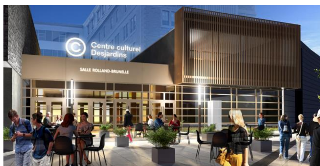
Figure 7: Centre Culturel Desjardins de Joliette Site : Centre Culturel Desjardins

https://www.google.ca/url?sa=i&url=https%3A%2F%2Fcfmj.net%2Fles-travaux-sont-commences-a-la-salle-rolland-brunelle%2F&psig=AOvVaw3UGlQ3P6SiiQQ4NjeByNKO&ust=1682084326732000&source=images&cd=vfe&ved=0CBEQjRxqFwoTC