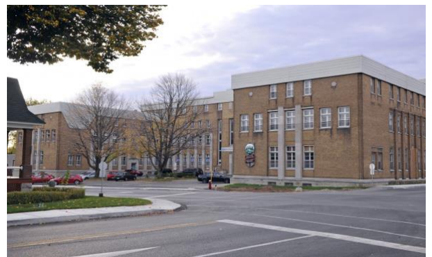
Figure 3: École les Mélèzes

La construction de ce bâtiment fut en 1935, et avait comme fonction d'être une école ainsi qu'un pensionnat. Ce dernier a accueilli des Sœurs de la Congrégation Notre-Dame dès le début des années 1900, et vers la fin de cette ère, le bâtiment est devenu une école mixte accueillant plusieurs enfants de niveaux primaire et préscolaire. L'allure de l'école a été bien préservée et bien que rénové à travers les années, le bâtiment démontre par certains aspects, la conservation de son passé religieux.