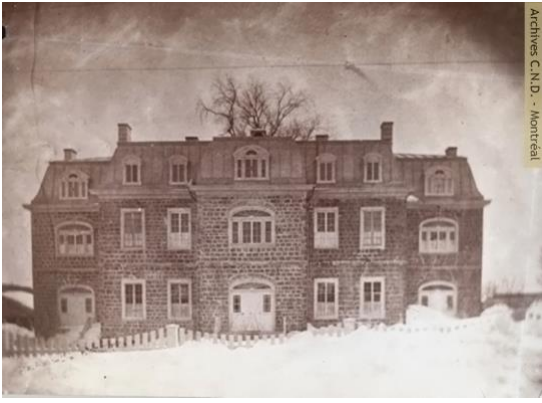
Figure 5: Les Mélèzes dans les années 1900 (Manoir de Barthélemy Joliette)

https://www.google.ca/url?sa=i&url=https%3A%2F%2Farchivesvirtuelles-cnd.org%2Falbum-ecoles%2Fcouvent-de-la-congregation-de-notre-dame-pensionnat-notre-dame-de-la-protection-ecole&psig=AOvVaw2zEc98uQ1iUz-AKivoLNbs&ust=1682084495024000&source=images&cd=vfe&ved=0CBEQjRxqFwoTCLiegpnLuP4CFQAAAAAdAAAAABAO