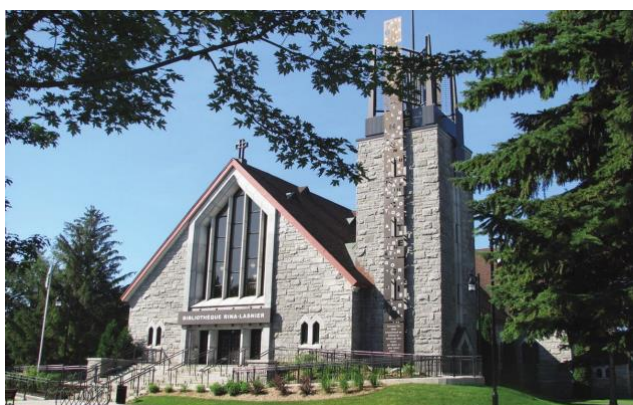
Figure 9: Bibliothèque Rina-Lasnier Site : Bibliothèque Rina-Lasnier

La bibliothèque Rina-Lasnier est réputée pour sa superbe architecture due à son aménagement dans l'ancienne église Saint-Pierre. La bâtisse a été construite en 1954 et la ville de Joliette l'a achetée en 2005 pour la création de la bibliothèque qui a ouvert officiellement ses portes en 2007. De plus, la transformation de l'église à la bibliothèque est l'un des plus beaux exemples de transformation d'église réalisée au Québec. La bibliothèque a pour mission d'offrir le meilleur service de documentation aux citoyens grâce à sa vaste collection de plus de 133 000 documents incluant des livres, des disques compacts, des DVD, des jeux vidéo et près de 120 titres de magazines et de journaux.