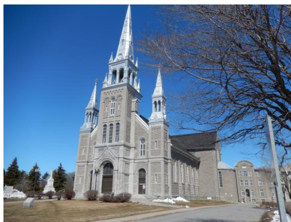
Figure 8: Cathédrale Saint-Charles-Borromée de Joliette https://www.google.ca/url?sa=i&url=https%3A%2F%2Ffr.wikipedia.org%2Fwiki%2FCat%25C3%25A9drale_Saint-Charles-Borrom%25C3%25A9e_de_Joliette&psig=AOvVaw1fY-z_la59SFM8qzQM4JrX&tust=1682082917543000&source=images&cd=vfe&ved=0CBEQjRxqFwoTCMDD36jFuP4CFQAAAAAAdAAAAABAE

Ce lieu de culte renferme aussi des trésors historiques, comme des cadres, des tableaux, etc. Ce lieu préserve une riche histoire historique et son architecture est impressionnante.