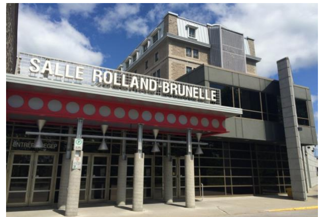
Figure 6: salle Rolland-Brunelle

Cette salle de spectacle a été construite en 1927 et rénovée en 1997. Ce lieu unique accueille depuis des années, de nombreux artistes, chanteurs, spectateurs, etc. Elle contient 775 sièges et aujourd'hui, on y programme plus de 150 spectacles de toute sorte pendant la saison hiver-printemps. Cette salle est un attrait patrimonial historique intéressant, dû à l'histoire du créateur, le Père Brunelle qui a lui-même formé un grand nombre de musiciens professionnels à ce jour, tels que la violoniste Angèle Dubeau et le chanteur Yoland Guérard. Les diverses configurations que la salle peut offrir amènent un aspect unique à cet endroit.