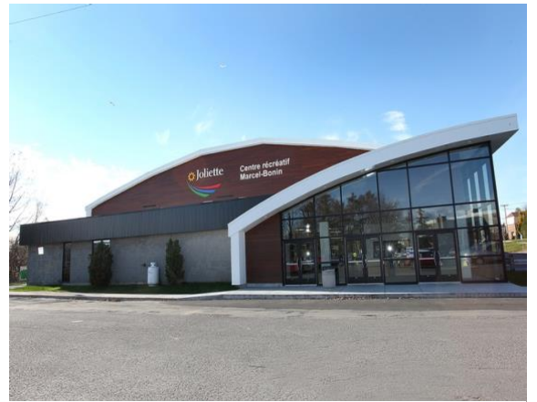
Figure 2: Aréna de Joliette

Après de nombreuses rénovations, cette bâtisse a eu la chance de subir une cure de rajeunissement, tout en étant mieux adaptée en fonction de la réalité d'aujourd'hui. La ville souhaite que tous puissent bénéficier d'une expérience sécuritaire et plaisante. En plus de servir le club de patinage artistique local et le hockey mineur, l'Aréna propose de septembre à avril, des heures de patin libre. Cet aréna constitue un attrait du divertissement de la ville.