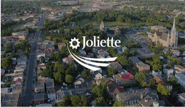
Figure 1: logo de la ville de Joliette

La ville de Joliette fut nommée en l'honneur d'un grand homme d'affaires, Barthélemy Joliette. Dans le cas où vous auriez entendu discuter du complexe de moulins en bordure de la rivière L'Assomption, c'est en partie grâce à cet entrepreneur, qui en 1823 la mit en chantier. C'est alors que le village de l'Industrie