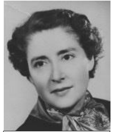
Rina Lasnier ; Bibliothèque Rina- Lasnier

aborde souvent le thème de la religion, plus précisément la relation entre l'homme et Dieu, ainsi que les émotions qui peuvent être rattachées à celle-ci. En plus d'être une artiste à temps plein, elle était très impliquée auprès de la fondation de l'Académie canadienne-française ainsi qu'auprès du Conseil des arts de la province de Québec en compagnie d'autres écrivains, soit Victor Barbeau, Alain Grandbois ainsi que Lionel Groulx. C'est en venant s'installer à Joliette en 1955 qu'elle se sent plus inspirée que jamais. Elle a publié certaines œuvres qui font partie des « fondements » de l'art poétique que nous connaissons aujourd'hui. Par exemple, ses poèmes Présence de l'absence (1956) et Mémoire sans jours (1960) sont des recueils qui ont marqué la poésie québécoise. Elle était connue pour avoir un style d'écriture qui est transparent et qui « souligne la cruelle opacité du monde » 4 . La bibliothèque porte son nom afin de rendre hommage à la poète et dramaturge qu'elle était.