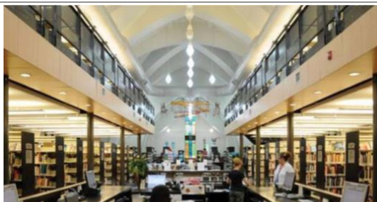
Intérieur récent ; conseil du patrimoine religieux du Québec

les ouvriers manquaient d'espace à l'intérieur. Le sous-sol a donc été fermé pour « conserver l'intégralité de la nef » 2 . Afin de maximiser l'espace le plus possible, ils ont construit une mezzanine.