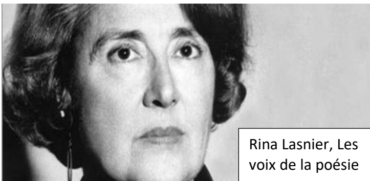
Rina Lasnier, Les voix de la poésie

La collection de la bibliothèque Rina-Lasnier est très diversifiée. Elle ne compte pas seulement des livres, mais aussi des disques compacts, des DVD, des jeux vidéos et plus encore. La collection compte environ 130 000 documents en tout.