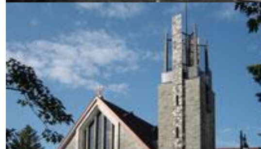
Architecture extérieure 1 ère église Saint-Pierre /aujourd'hui Bibliothèque Rina-Lasnier