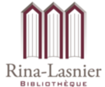
Le logo ; Bibliothèque Rina-Lasnier

Le logo de la bibliothèque Rina-Lasnier a une signification particulière. En effet, il y a trois concepts liés à la bibliothèque : la culture, le savoir et le patrimoine. Pour représenter le savoir, trois livres posés à la verticale composent ce logo. Ensuite, la culture est représentée par le nom de Rina-Lasnier. Pour finir, le patrimoine est représenté par le positionnement des livres qui donne l'impression d'apercevoir trois fenêtres, ce qui représente l'architecture d'origine du bâtiment.