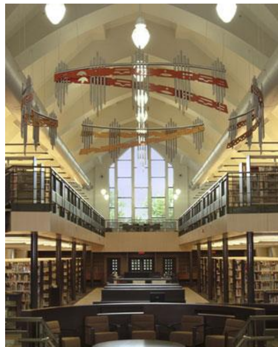
La sculpture ; Bibliothèque Rina-Lasnier

Lors de notre circuit, nous avons jugé pertinent de faire un arrêt pour observer la sculpture qui se trouve au centre de la bibliothèque. Même si plusieurs semblent l'ignorer ou ne pas la remarquer, cette œuvre détient des éléments majeurs qui contribuent au patrimoine de l'église. Nommée « entre partition et manuscrit » 3 , cette œuvre a une signification importante qui rend plus riche encore l'histoire de l'église. Joëlle Morosoli est l'artiste qui a créé cette œuvre, en collaboration avec Rolf Morosoli. Ils ont d'ailleurs créé plusieurs autres œuvres ensemble. Leur but premier était de démontrer les quatre états symboliques de l'évolution d'un livre, et c'est pour cela que la thématique de cette sculpture est complétée par un livre qui a des pages d'aluminium. Tout en voulant rappeler l'histoire de l'ancienne église, l'œuvre est également composée de tuyaux d'orgue, pour ainsi faire un clin d'œil à la région de Lanaudière. De plus, il y a quatre types d'écriture pour