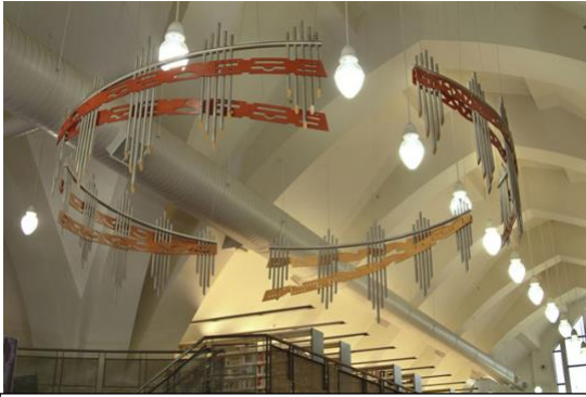
La sculpture ; Bibliothèque Rina-Lasnier

démontrer un certain type d'évolution. On retrouve l'écriture cunéiforme, les hiéroglyphes, l'écriture carolingienne ainsi que les pixels. Cette œuvre a une grande importance étant donné sa signification, et c'est pour cette raison qu'elle restera exposée pour les années à venir. Il y a plusieurs autres œuvres présentes dans la bibliothèque, l'établissement faisant une rotation des collections d'arts toutes les 6 ou 12 semaines. Il est donc possible pour des artistes locaux de faire une demande pour que leur art soit exposé à la vue de tous.